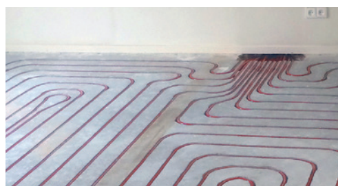
Sparing door installateur