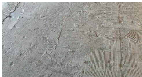
Afkeur vanwege oneven heden en lijmresten