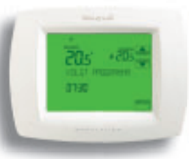
Klokthermostaat Chronotherm Vision Modulation