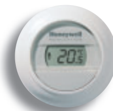
Kamerthermostaat Round Modulation