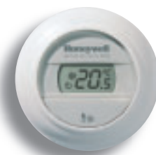
Kamerthermostaat Round Heat/Cool